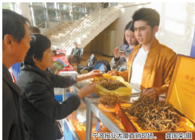
宁波报业大厦直销现场。

如果您还有关于那曲冬虫草的问题,可拨打读者专线 87682680、87682652、15867896011 咨询;也可前往宁波晚报厂商直通车活动现场与工作人员面对面交流。