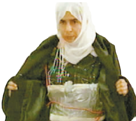
女恐怖分子里沙维。