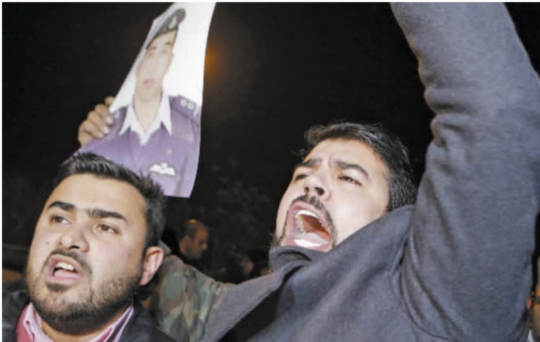
约旦民众要求政府以女囚换被俘飞行员。

约旦政府28日说,如果极端组织“伊斯兰国”释放约旦飞行员马阿兹·卡萨斯贝,政府愿意释放这一极端组织先前“点名”的恐怖囚犯。但没有提及遭“伊斯兰国”绑架的日本人质后藤健二。