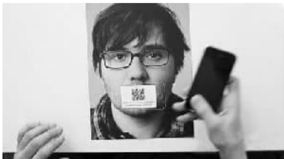
一名求职者的创意简历利用上了二维码

不少人在找工作时会花些心思,务求给面试官留下深刻印象。这些奇葩的应聘者中,有的人用蛋糕求职,有的人寄鞋子求职,还有人把简历做成打包盒、急救箱,花样百出。而收到这些“奇葩”简历,究竟人力资源主管们是开心地把其“纳”进公司,还是觉得太过古怪,让其出局呢?