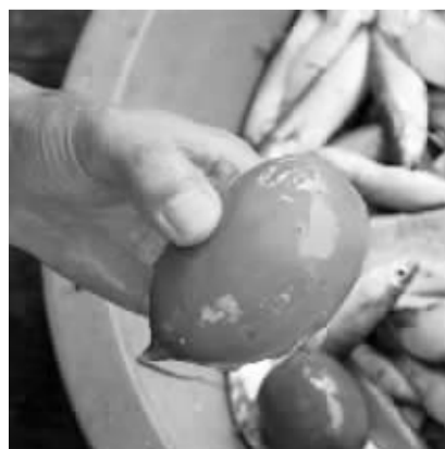
新鲜的“海番薯”。

据市水产行业协会公布的统计报告显示,去年1月至9月我市水产品出口总额前十位中,冻、干海参(俗称海番薯)出口额居第二位,出口量超过1109吨,出口总额为4714万美元。