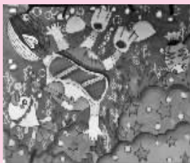
▶我的一家 余姚市新东方 实验幼儿园小1班 黄予然 (证号1514950) 指导老师 马超