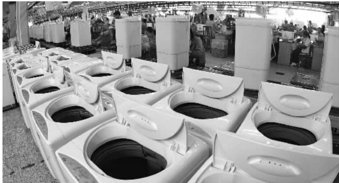
宁波一家企业的洗衣机生产线。

宁波市的洗衣机产品质量到底如何,与一线品牌差距在哪?这次,宁波地产洗衣机生产企业与一线洗衣机品牌来了个PK。昨天,浙江省质监局、宁波市质监局、宁波市家电协会在洗衣机产业最为密集的慈溪首次发布洗衣机产品质量比对结果,参加比对的一方洗衣机大多是宁波本地制造,活动方还在市场上随机购买了10个批次知名品牌产品进行比对项目的检测试验。