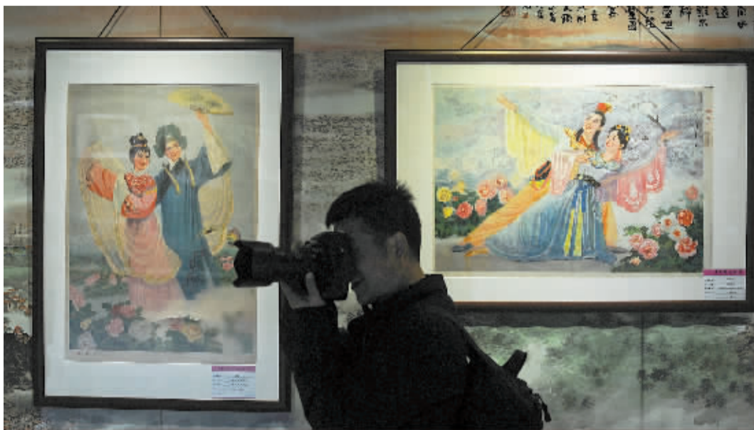
梁祝年画展也吸引了不少摄影爱好者。