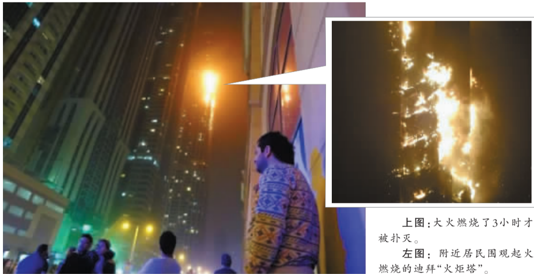
上图：大火燃烧了3小时才被扑灭。

阿联酋城市迪拜一栋高达336米的79层公寓楼21日凌晨突发火灾，蔓延至多个楼层，现场不断掉落大量燃烧的碎片。火情在持续大约3个小时后被扑灭，目前没有人员伤亡的报道。