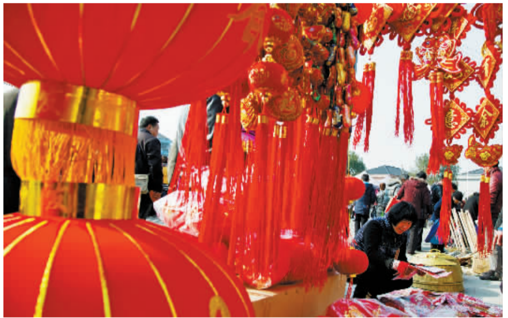
中国红火红红

春节的甬城,街头巷尾,处处都洋溢着和谐、休闲的喜庆氛围,漫步街头,总会被周围那浓浓的年味所感染。