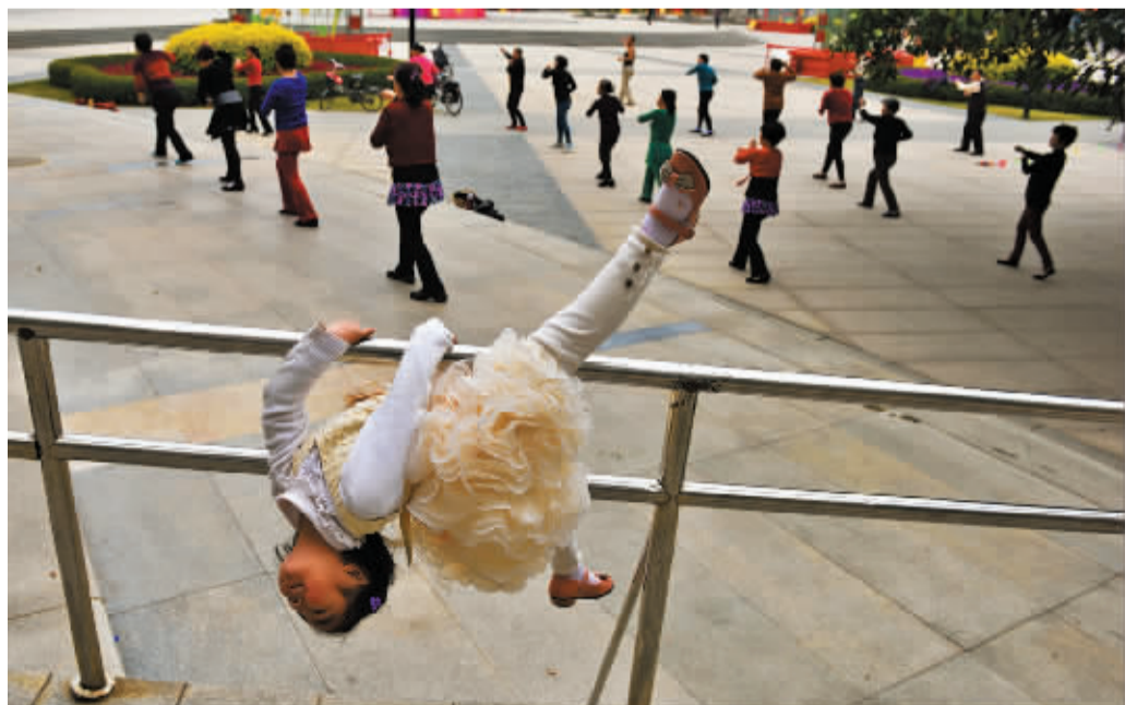
真功夫 晚报拍客 老方先生