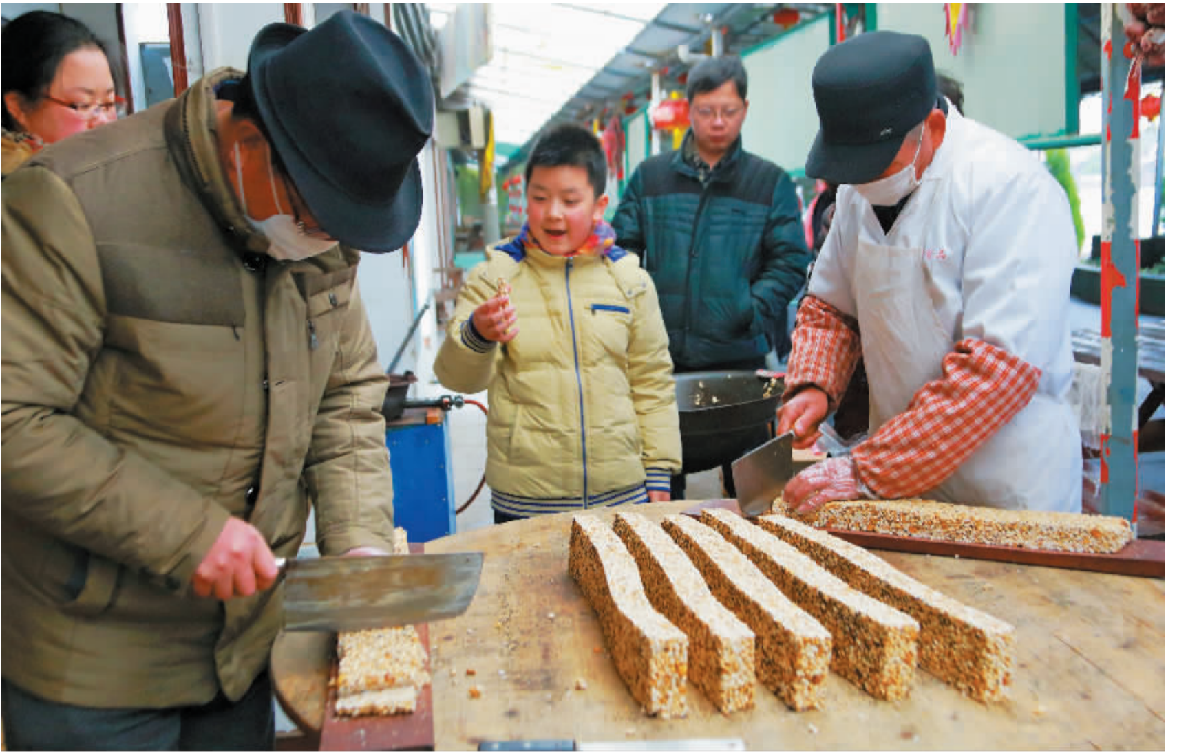
传统的冻米糖制作更富有年味。