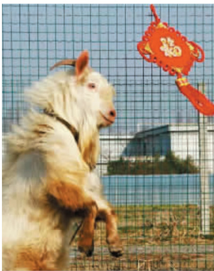
喜羊羊 晚报拍客 背靠背