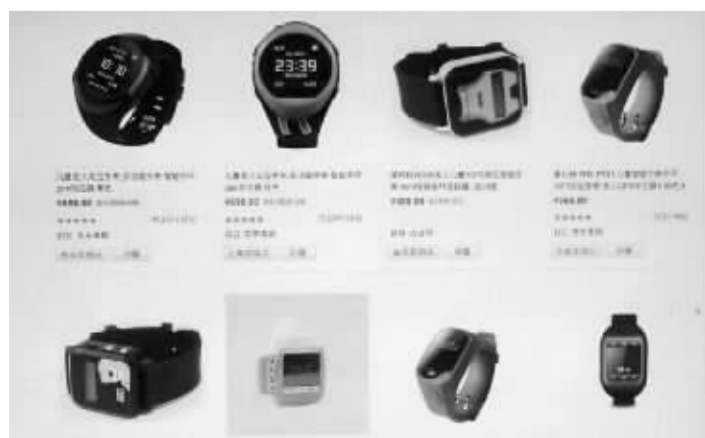
网上热卖的各种GPS定位器。 网页截图

老人戴上腕表后，如遇突发疾病等意外情况，可一键呼叫到12349，及时得到救援和服务。养老服务信息平台还会定时主动抓取老人的脉搏、心率等生命体征，儿女每天会收到老人的生命体征监测数据，当出现异常时会发出警报，并在第一时间通知老人的家人或120进行急救。为防止高龄独居老人走失、迷路，腕表自带的GPS定位系统，随时将老人的行踪发给亲属及其他救助人员，便于精准锁定迅速施救。