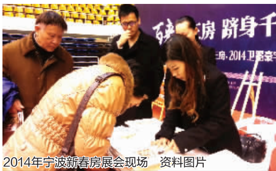
2014年宁波新春房展会现场

半年新春,楼市利好消息频传:先是央行继降准之后再度降息,而后全国两会上传递出中央“稳定住房消费”、“支持居民自住和改善性住房需求”的消息。