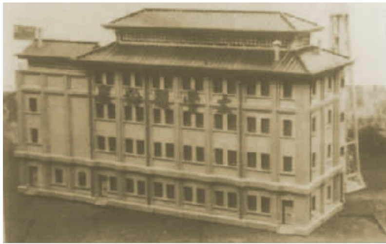
上世纪五十年代的太丰面粉厂