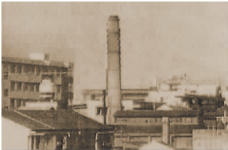
上世纪五十年代的宁波榨油厂