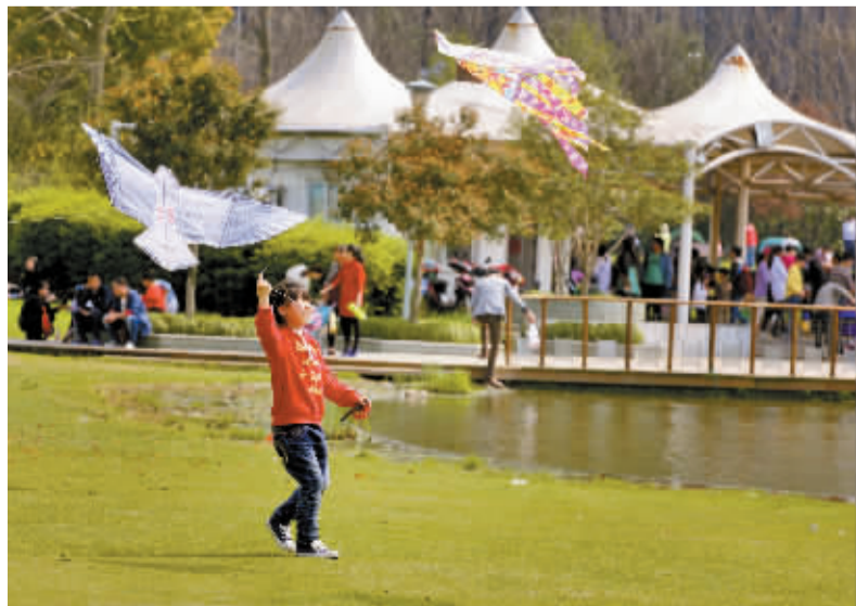
连日来,天气舒适,春光烂漫,不少人在鄞州公园放风筝。