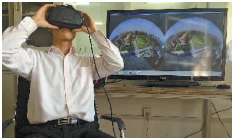
市民在试用宁波最新研制出来的虚拟现实视觉传感器。

今年我市将着力培育境外生产制造、贸易营销和资源开发等三大基地建设,推动宁波企业赴“一带一路”沿线港口建设境外公共“海外仓”。并鼓励“千军万马”走出去,推动甬企“抱团出海”,赴“一带一路”国家投资合作。