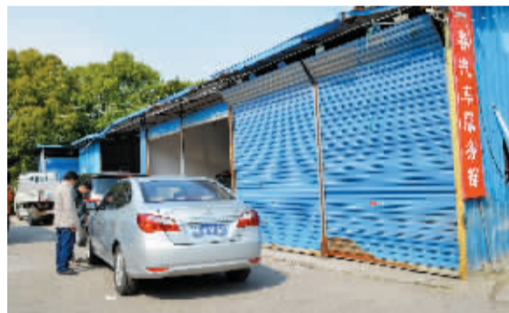
这家违法搭建的汽修店被勒令限期拆除。

昨天下午,以上部门组成的联合检查组反馈记者说,除了这家汽修店租用的临时房外,附近的数间用作仓库和经营用的房子,都是违法建筑。目前,检查组已通知相关责任人限期自行拆除,逾期将予以强拆。