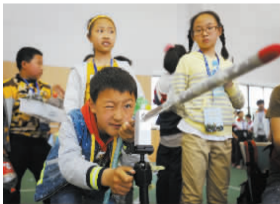
航模小选手神情很专注。

另一项同时进行的市青少年静态模型大师赛共设5个竞赛项目，其中有3个项目是承办单位高新区实验学校新研发的原创产品。学校教导主任、科技辅导员张伟强告诉记者，做东道主的一大好处是能多组织一些孩子参赛。“赛程规定参赛学校每队一般只能组织12个学生参加，但我们有80多个学生参赛”。去年组织比赛，因为参赛人数有限，好些学