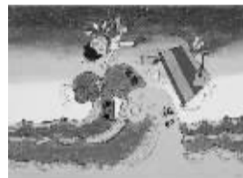
法律无情 410班小记者 王潇然(证号1530100)