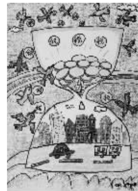
税收带来祖国美 406班小记者 柴宇星(证号1530065)