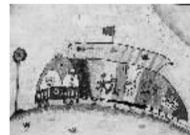
税收号 410班小记者 钟卓洋(证号1530104)