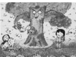
抓害虫 408班小记者 岑一炜