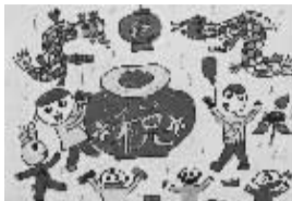
交税 403班小记者 方宏鸣