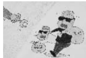
无处可逃 509班小记者 方瑜轩