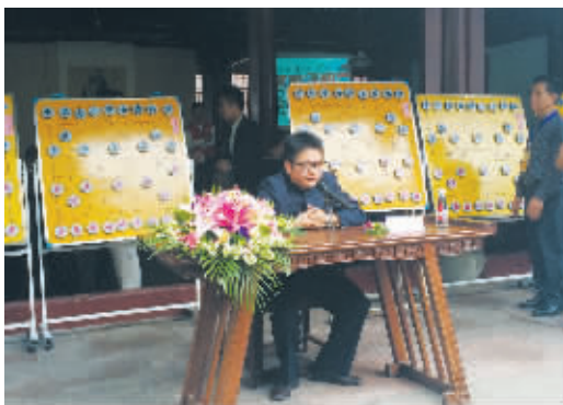
蒋川背对棋盘展示盲棋魅力。

有幸与蒋川对垒的12位选手都是在前期选拔中脱颖而出的高手。其中6位来自宁波象棋协会,4位由线上游戏平台海选而出,2位由组织方推荐。