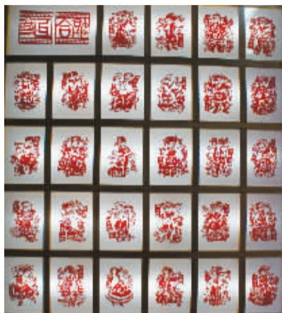
居民创作的少数民族造型剪纸。