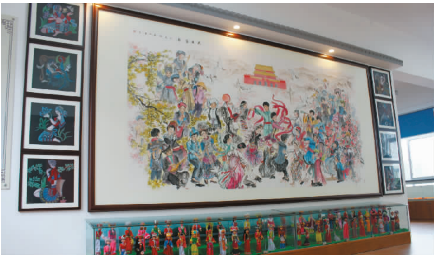
这幅4米长的画是社区书画联谊会成员创作的。