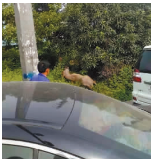
倒在灌木丛中的疯牛。