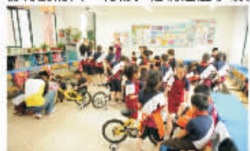
古林镇中心小学梦想新城游园会

两场活动,作为育乐湾首次大规模对外输出活动,是宁波文化广场育乐湾成为少年儿童社会实践教育基地后又一个新的里程碑。一个更为自由化、社区化的活动模式将是育乐湾未来发展的重点,同时将致力于融合更多的社会资源,提供更为优越的学习体验平台,让孩子能够更方便自由的享受这场快乐的未来之行。