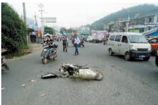
被疯牛撞倒的电动自行车。