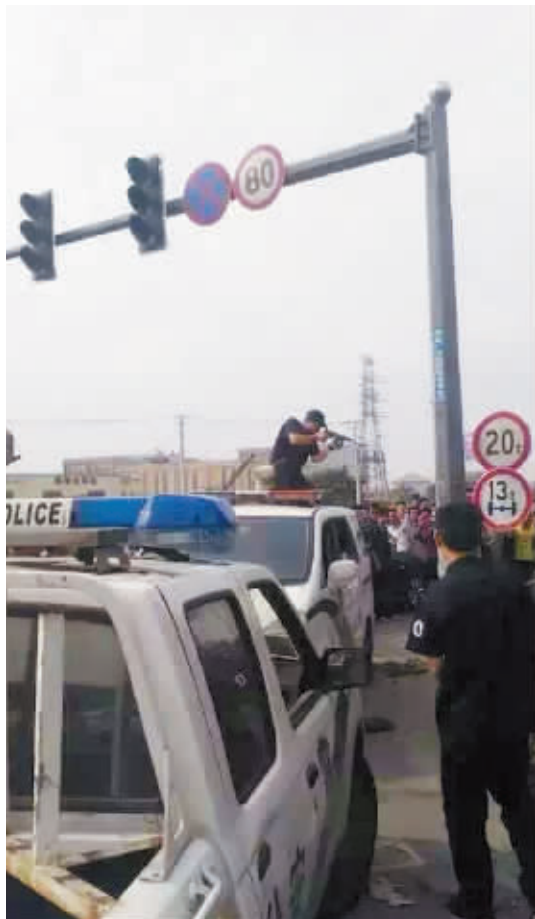
特警车顶瞄准。