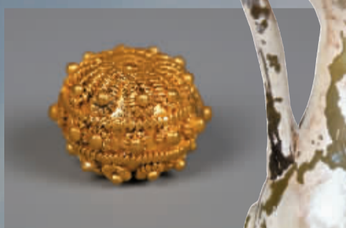
合浦汉墓出土鼓形缠花金球