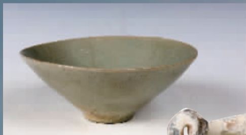
高丽青瓷印花纹碗