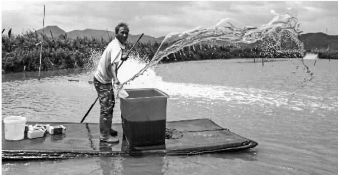
昨日上午,宁海一市镇养殖户正对养殖塘消毒。