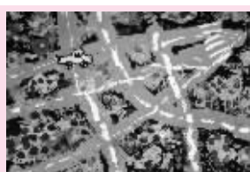
马路 第三幼儿园 中四班 袁一涵 指导老师 顾科青 郑聪