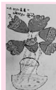
奇妙的莲蓬 江东中心幼儿园 东海园区大三班 胡妙歌