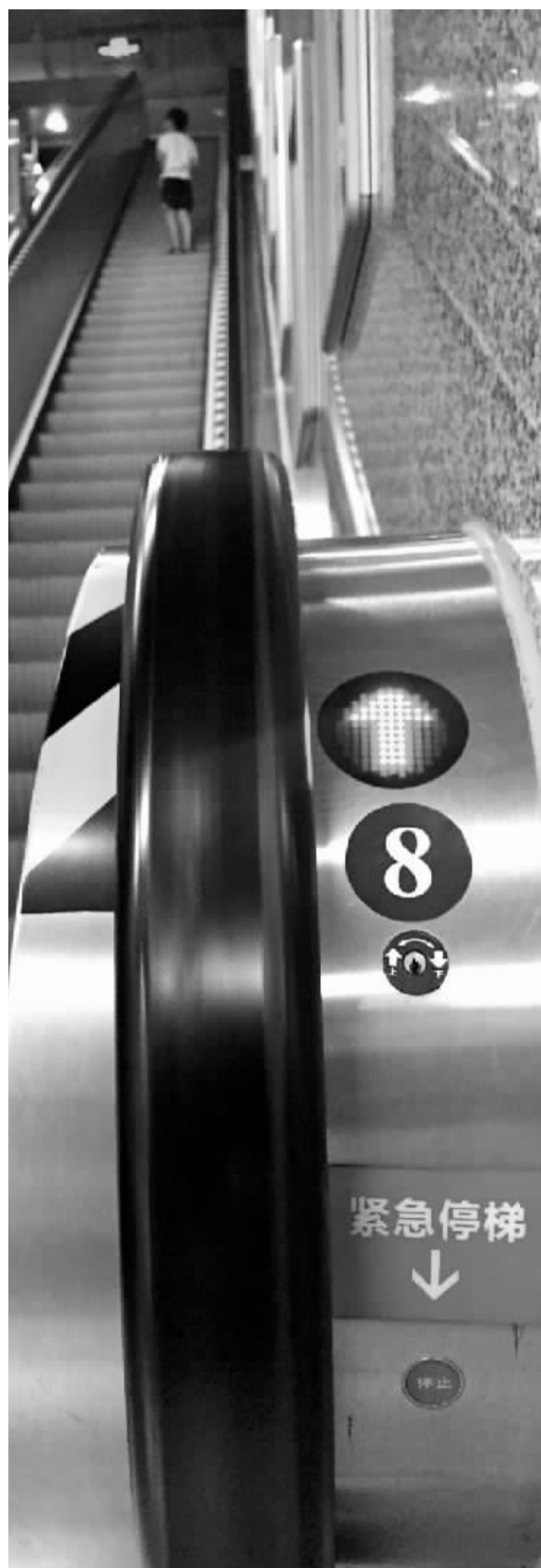
轨道交通1号线泽民站扶手电梯入口下方的紧急按钮。

据了解,目前《宁波市电梯安全管理办法》正在市政府法制办进行公示,不出意外的话年内即可出台。