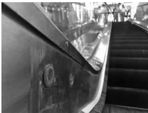
海曙麦德龙扶手电梯出口内侧的紧急按钮。

用,再次启用扶梯时再按动一下即可。安全触发开关也称作扶手带开关,平时主要是在乘客衣服等物品夹到扶手带后用于紧急制动,一般用脚踢一下就可以了,而想要再次启用扶梯,则需要打开电梯盖板按动里面的开关。