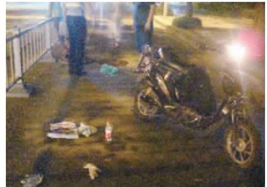
就是这个窨井令顾师傅大吃苦头。

一旦遭受伤害而现场又找不到负责人该怎么办呢?民警说,应首先弄清窨井盖的所有权人或者管理人。在确定窨井的归属权后,可依据相关法律,通过协商或向法院起诉的途径维护自身合法权益。受害人与管理方(施工方)应根据过错承担相应的责任。