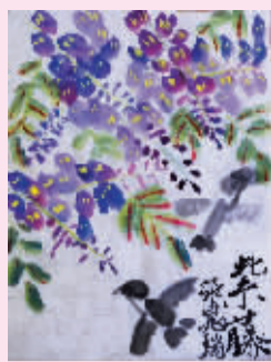
▲紫藤 镇安小学202班小记者 张晁瑞(证号1521652) 指导老师 高文雅