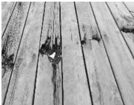
慈湖公园的木栈道多处缺失、破损。

本报讯(记者 边城雨) “慈湖公园的木栈道多处缺失、破损严重,行人走在上面,不小心就会‘中招’。管理方也没有在上面设一个提醒标志,如果发生了意外就不好了。”昨天一大早,市民徐女士和家人在慈湖公园游玩时发现,这里的木栈道“伤痕累累”,非常危险。