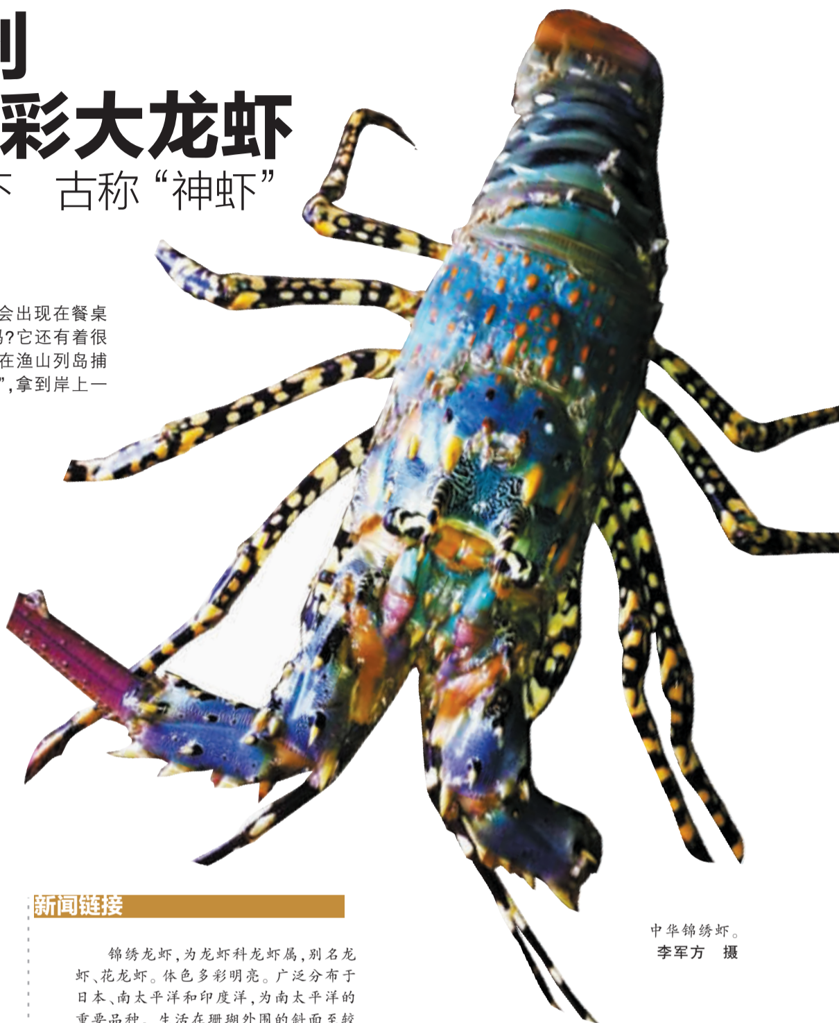
中华锦绣虾。

不过李军方没有养殖龙虾经验，担心时间一长，龙虾会死。“现在等待有人能够买下这只虾，再捐赠给海洋博物馆。也希望水族馆的人来买走供大家参观。”李军方笑着说。