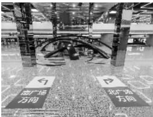
车站内的路面标示设置完毕。

据了解,虽然夏禹路隧道和高架已试通行,但青林湾往铁路宁波站方向匝道暂不通。同时,夏禹路地面部分,由于继续河道开挖、道路沥青、人行道铺装及绿化景观施工,暂时也无法通车。