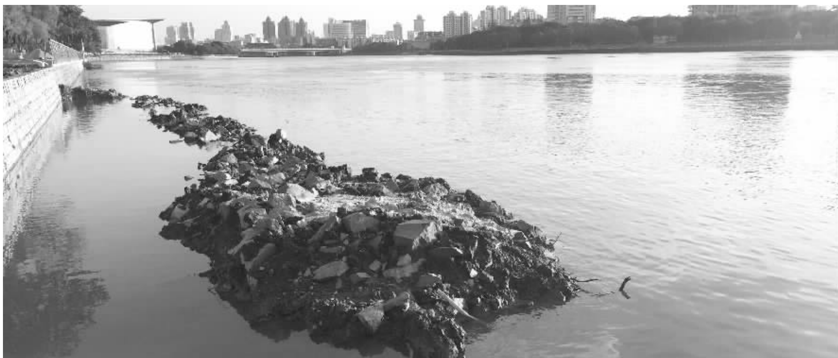
昨天傍晚,姚江江北段的水位已下降。经过持续候潮排水,姚江已为防洪留出库容。