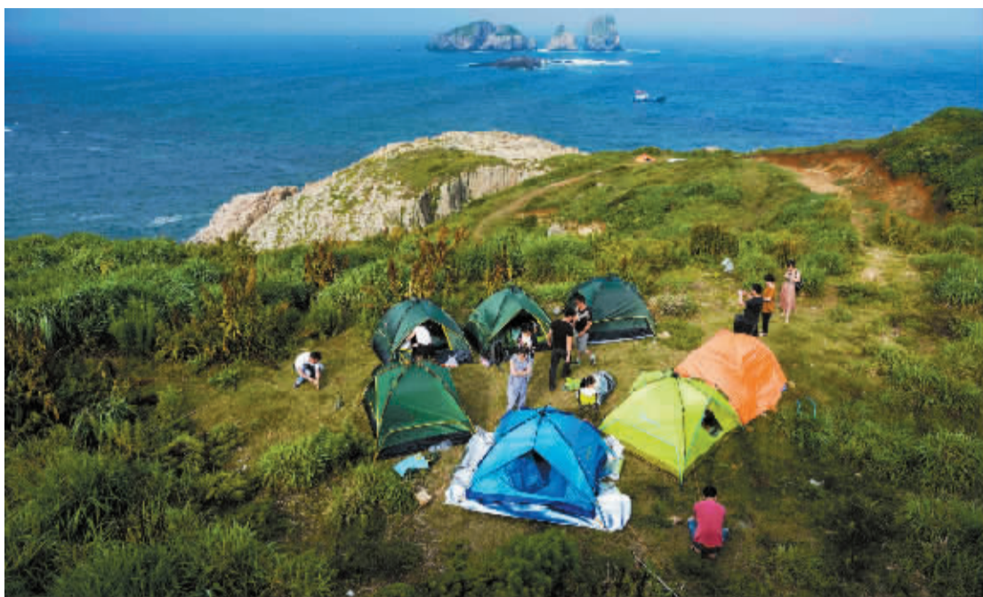
不少游客在渔山列岛“安营扎寨”。

记者了解到,前年起,当地管理部门就已经开始对渔山列岛开发利用进行规划控制,其中包括对岛上宾馆、海钓资源以及上岛游客、海钓爱好者数量等情况进行评估。