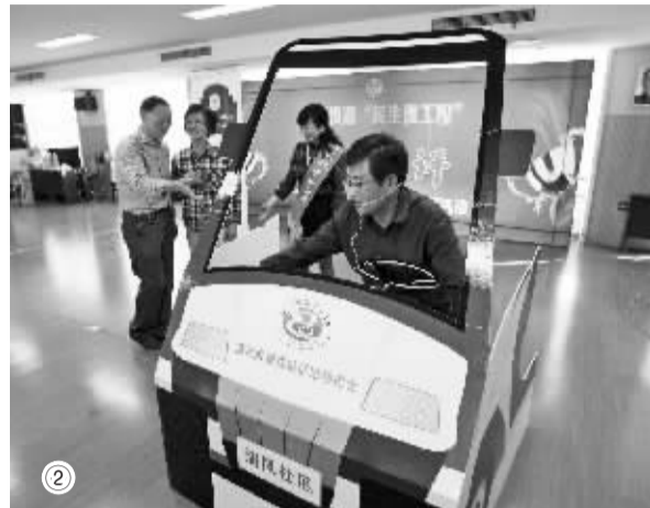
图①②：昨天下午，各个社区用小品、情景剧等方式参加民生微工程评选。