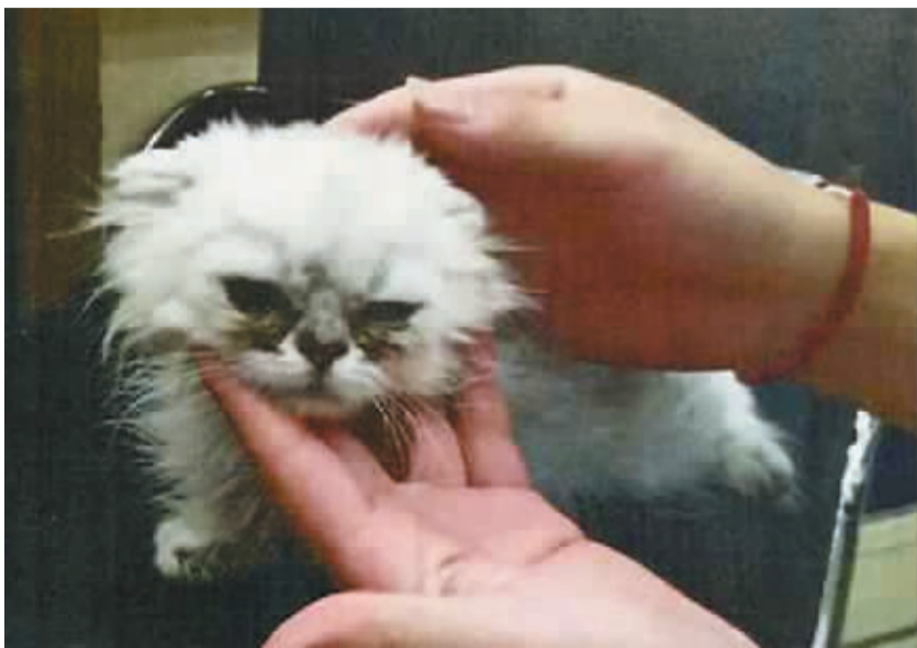
被偷的其中一只猫。