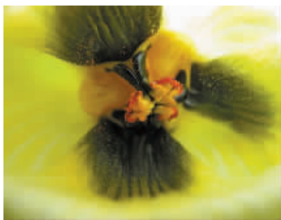
木鳖子的花的雄蕊