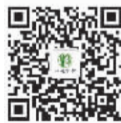
柏庭家护服务号二维码