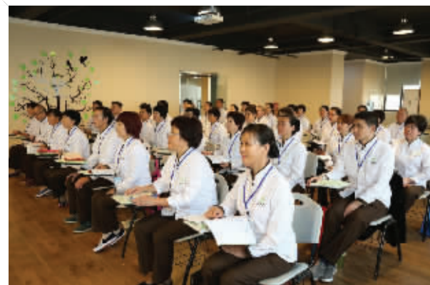
柏庭家护师培训班