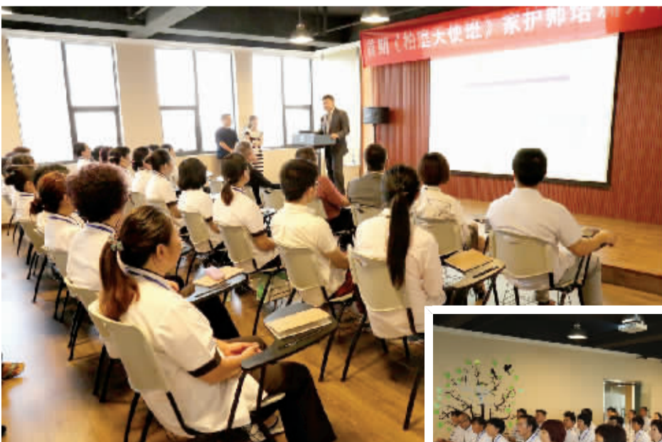
柏庭家护师培训班

面对“柏庭”家护师在市场上供不应求的现状，“柏庭”又着力打造了一个高端养老社区——宁波钱湖柏庭高端养老社区正在筹建。该养老社区地处宁波东钱湖镇，依山傍水，环境优美，距离宁波中心城区约15公里，周边有医院等医疗机构配套设施。院内有购物街，健身娱乐场所，理疗室，以及全套生活设施，是一个安静而时尚的老人居住社区。项目占地约130亩，总投资近10亿元人民币，建成后设床位2000张。养老公寓包括全自理、半护理和临时托老三种类型。预计2018年底开始对外服务。