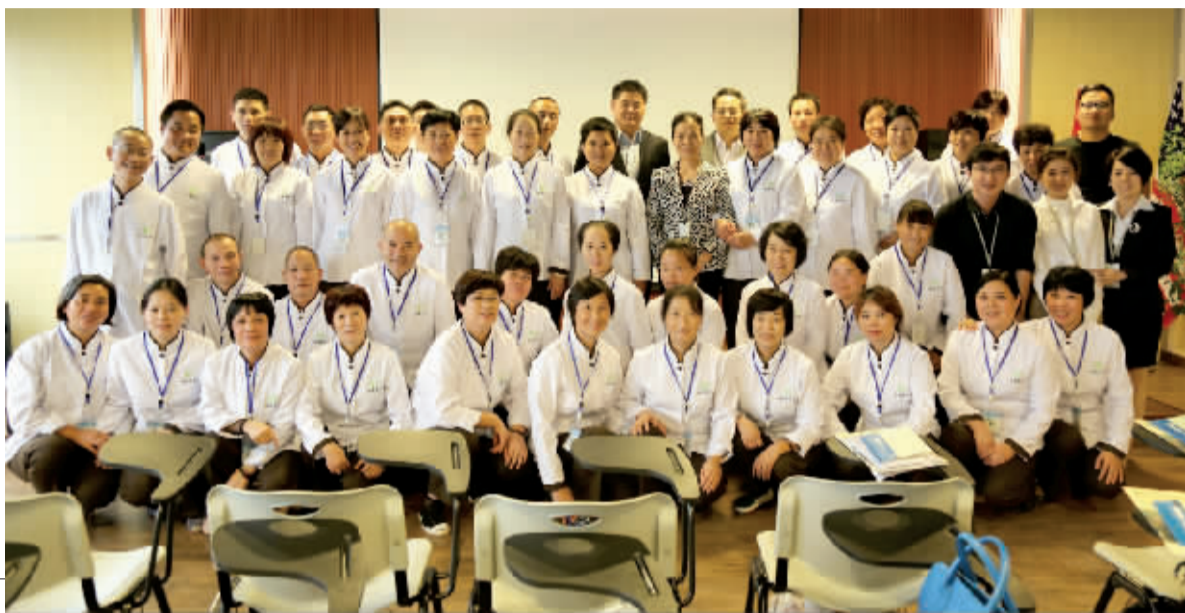
柏庭家护 “天使班” 二期合影