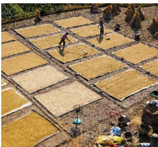
晒丰收 晚报拍客 张永元 摄