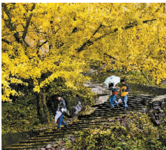
秋雨润山村