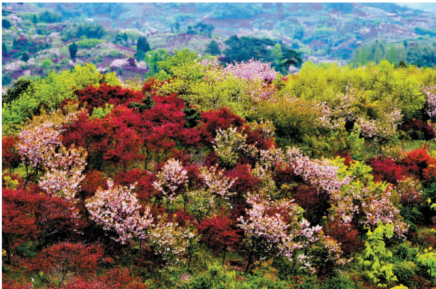
层林尽染