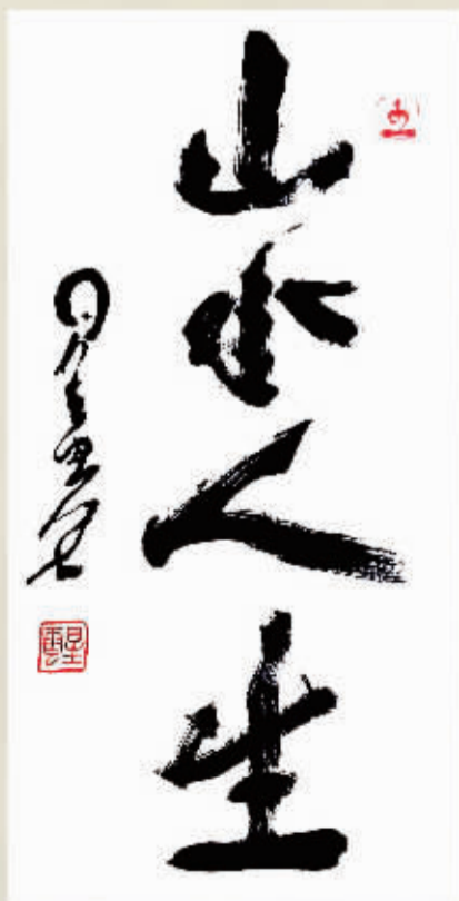
山水人生 星云(台湾)