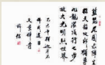
佛诞辰(遂宁) 诚信(浙江)