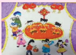
庆元旦 镇安小学305班小记者 曾佳仪(证号1521610)