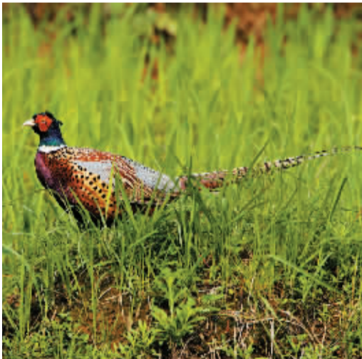
环颈雉,俗称“野鸡”,全国广布。