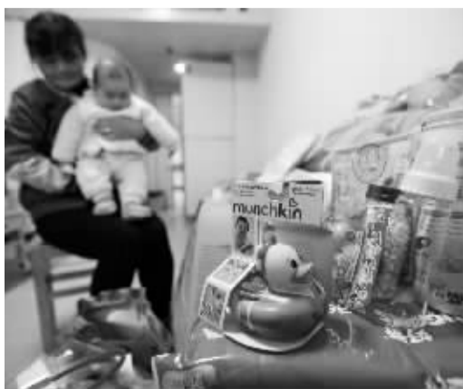
好心人送来不少婴儿用品。