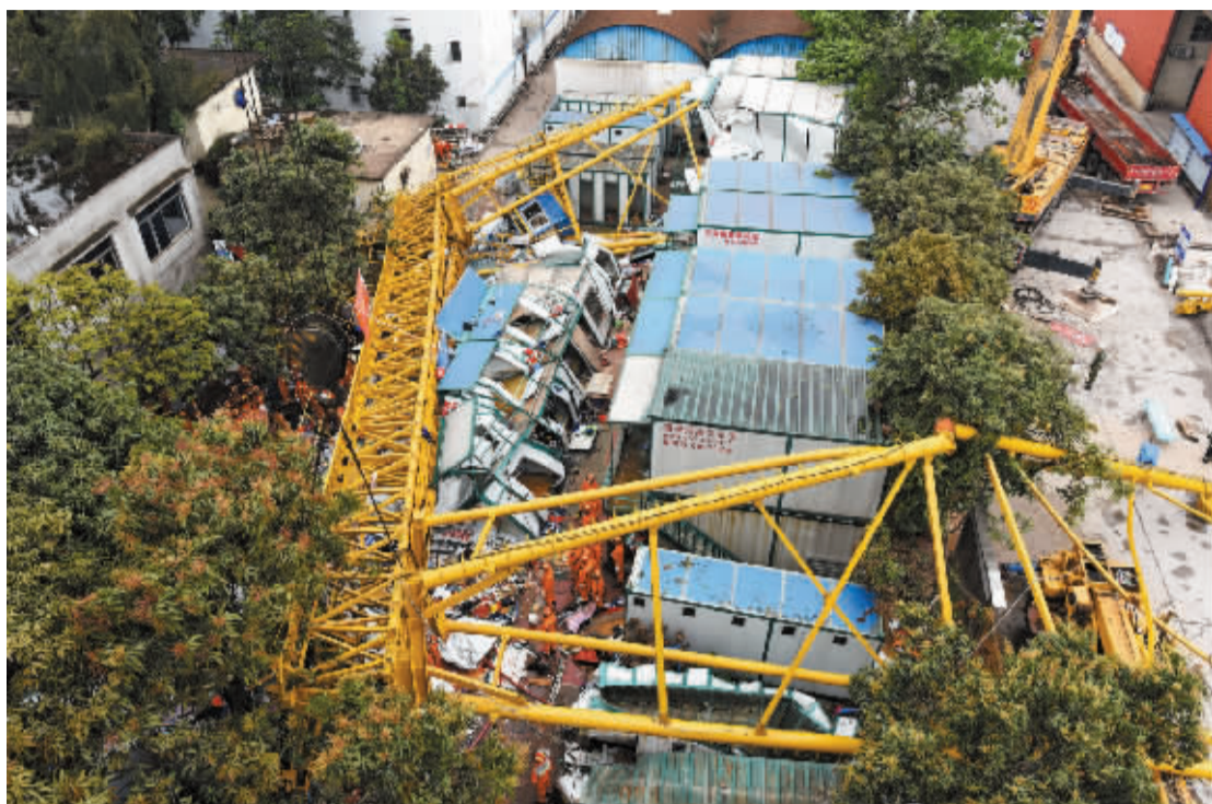
4月13日,救援人员在坍塌现场进行救援。

13日早晨,广东省东莞市麻涌镇一厂区发生龙门架倒塌事故,压垮附近数间住有工人的临时集装箱房,已致18人死亡,33人受伤。