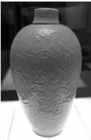
南宋景德镇窑青白釉刻划缠枝花卉纹瓷梅瓶