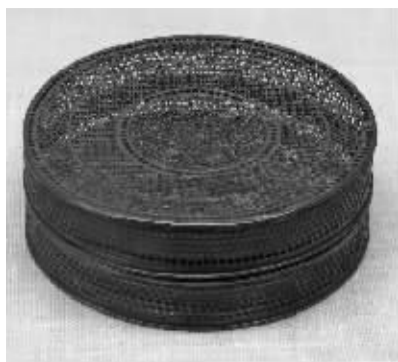
宋缠枝花卉纹镂空银盒