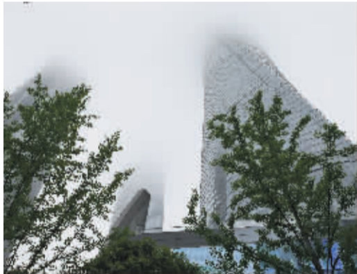
云雾缭绕的“上海中心”。(4月27日摄)

地下1层的“上海中心”展示厅也将参与首批对外开业。这里将为大家展现的“成长的天际线”、世界摩天大楼历史、“上海中心”基因库等精彩纷呈的展品展项,衍生品店也将让公众体验极具想象力、富有上海中心及上海独特文化元素的创意衍生品。