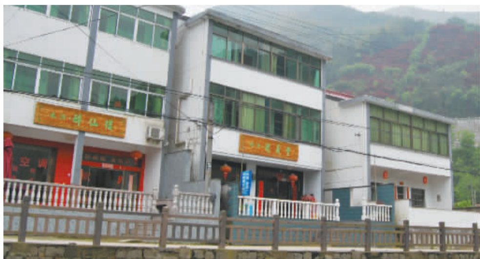
北溪村的一些酒楼,用的都是水浒中的名字。