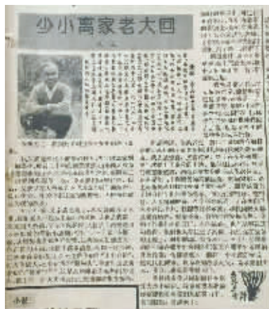
▲1992年10月1日,《奉化日报》第七版刊登了沈寂的文章。