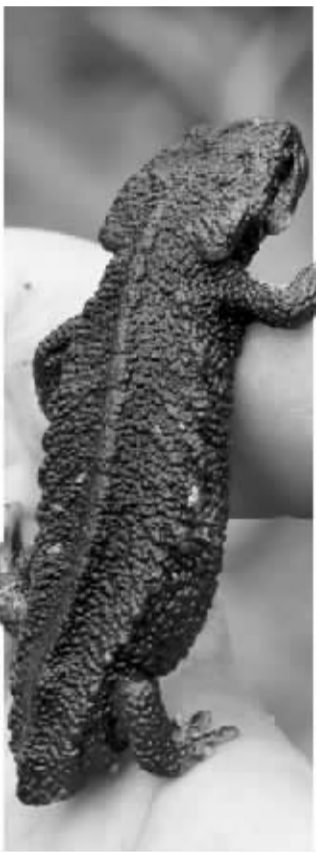
镇海棘螈。