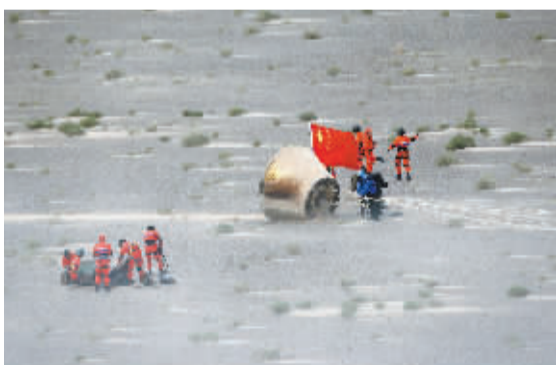
6月26日,由长征七号运载火箭搭载升空的多用途飞船缩比返回舱在东风着陆场西南戈壁区安全着陆。

制造等关键技术验证,对结构可重复使用设计和设备可重复使用技术进行研究。多用途飞船缩比返回舱飞行任务是未来我国新一代载人飞船飞行试验规划的第一步,将开启我国新一代载人飞船研制工程的序幕。