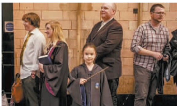
读者排队购书,有人还穿着“巫师袍”。