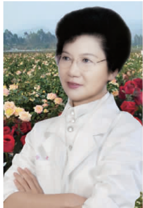
马肖琳健康与美丽信箱