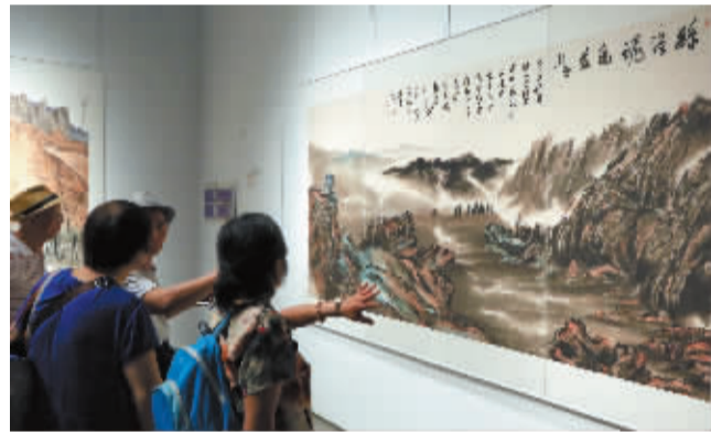
图为市民在参观展览。

新疆库车,是古龟兹国所在地,丝绸之路的重要节点,也是宁波的结对城市。去年,应宁波市援疆指挥部和库车县宣传文化部门的邀请,宁波市文联组织20多位书法、美术、摄影艺术家前往库车,开启了为期一周的创作之行。摄影家们用相机记录下一个个动人的瞬间,书画家们用丹青表达了宁波人民对库车人民和援疆人员的手足之情。